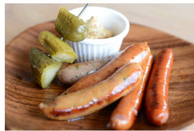
ソーセージ盛り合わせ