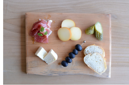
おつまみ盛り合わせ